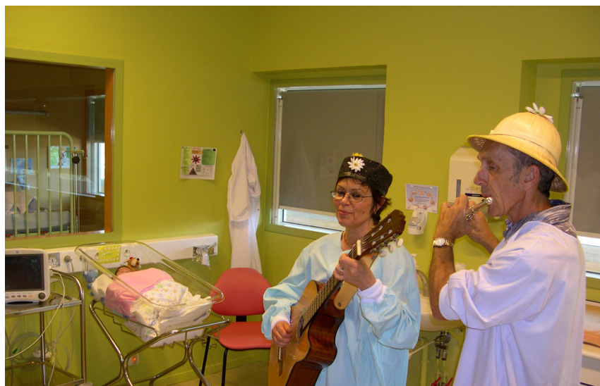
Musiciens Néonatalogie avril 2011

La convention « Culture et Santé » signée le 6 mai 2010 entre le Ministre de la Culture et de la Communication et le Ministre de la Santé et des Sports vise à assurer le développement des actions culturelles et artistiques au sein des établissements de santé.